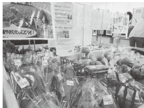
菜っちゃんでも射水産小松菜販売中です

7 月 15 日(金)小松菜の生育状況を確認する為、夏取り出荷の時期を前に営農管理センターにて「こまつな圃場巡回講習会」が行われ、多くの小松菜生産者が参加しました。