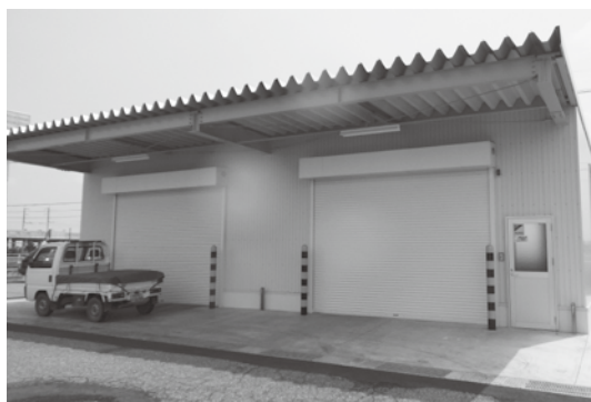
今年 4 月より稼働している小松菜倉庫(射水市大門本江)

圃場巡回では、営農組合など出荷量の多い 11 件の圃場を見て回りました。それぞれ品種や使用薬剤にも違いはありますが、相互に協力し、更なる栽培技術の向上を目指そうと、参加者らは葉色や生育状況の確認、情報交換などを行ないました。