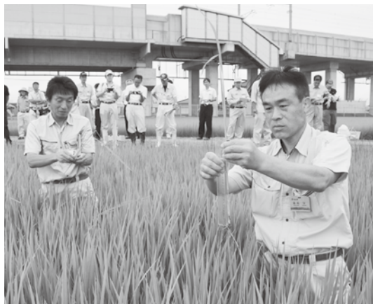
圃場にて稲の生育状況を確認